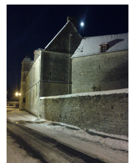
Clair de lune sous la neige

Rappel : Les déchets d'équipements électriques et électroniques doivent être déposés à la déchetterie.