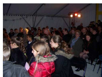
Arbre de Noël 2011

La fête pour l'arbre de Noël se déroulera le dimanche 16 décembre à partir de 16 heures 30.