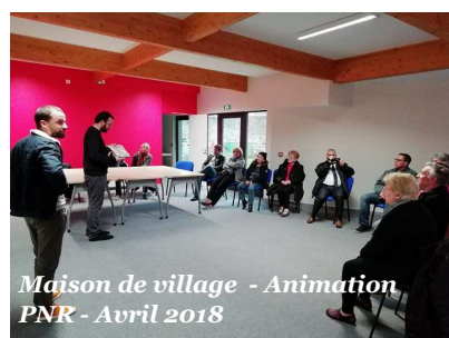
Maison de village - Animation PNR - Avril 2018