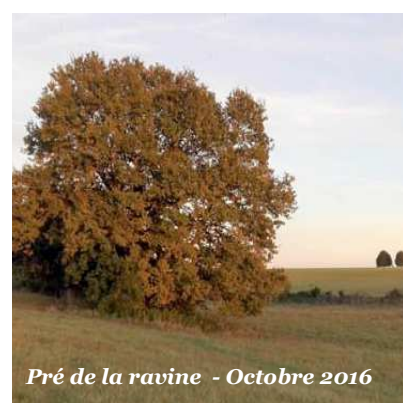
Pré de la ravine - Octobre 2016