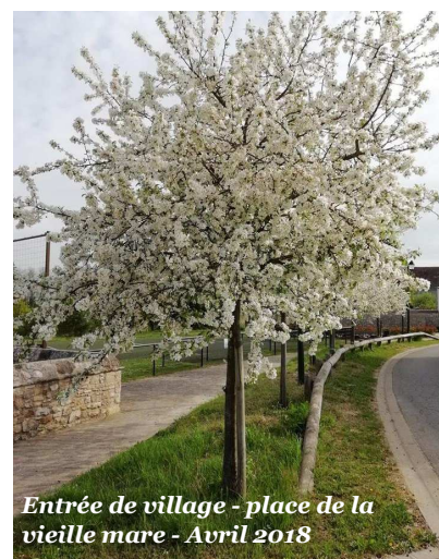
Entrée de village - place de la vieille mare - Avril 2018

http://moussy.fr/a-la-une/approbation-du-plan-local-durbanisme/