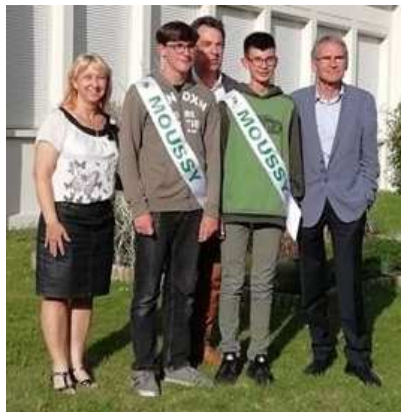
Remise des écharpes aux délégués du CIJ. Vigny, le jeudi 7 juin 2018.