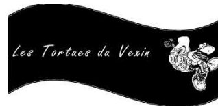
Le logo de l'activité VTT « les tortues du Vexin »