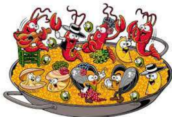
Fête du village—place de la vieille mare

Cette année, la kermesse a été écourtée en raison du mauvais temps. Après une éclaircie, les enfants ont pu en profiter qu'à partir de 17h30 pour se distraire sur les différents