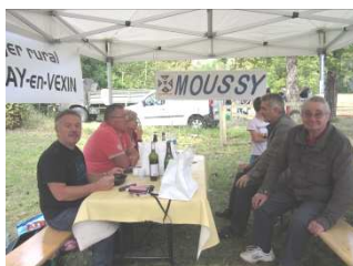
Le stand du foyer rural de Moussy au festival « Césarts fête la planète »

La communauté de commune Vexin Centre en collaboration avec la Compagnie Pile Poil ont reconduit cette année le